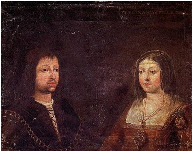
Øverst: Kong Ferdinand og Dronning Isabella, ca. 1467.

I Spanien flyttede Columbus og sønnen ind i et kloster, hvor munkene tog sig af hans søn. Lederen af klosteret var venner med den spanske dronning Isabella, og klosterets munke havde mange gode forbindelser rundt omkring i Spanien, og dem benyttede Columbus sig af og overbeviste dem om, at de skulle støtte ham i hans ide om at finde søvejen til Indien. I 1486, da han var 35 år, lykkedes det ham at møde Kong Ferdinand og Dronning Isabella og fremlægge sine planer for dem: om at ville nå Indien ved at krydse Atlanterhavet. Efter noget tid besluttede dronningen at ansætte Columbus. Han havde lokket hende ved at forklare, hvordan guldet, han kunne tage med fra Indien, kunne bruges til at befri Jerusalem, som på det tidspunkt var i muslimsk besiddelse. Og Jerusalem var vigtig at få befriet, da byen bliver betragtet som den mest hellige by inden for kristendommen, da det var her at Jesus døde.