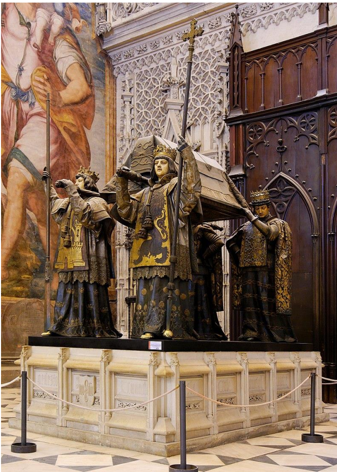
Columbus' sidste hvilested, Sevilla, Spanien.

To år senere døde Columbus. Han fik en enkel begravelse uden deltagelse fra kongefamilien. Columbus' rester er flere gange blevet gravet op og begravet forskellige steder fx på Haiti og Cuba. I dag kan man besøge hans kiste i Sevilla i Spanien.