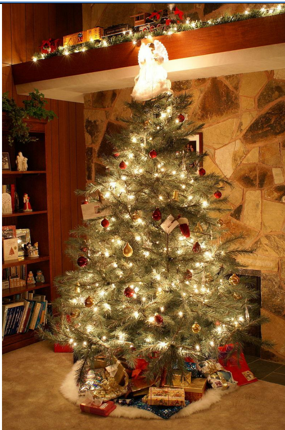
Juletræ med gaver